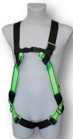
Abb. MB30-2T Vorderseite