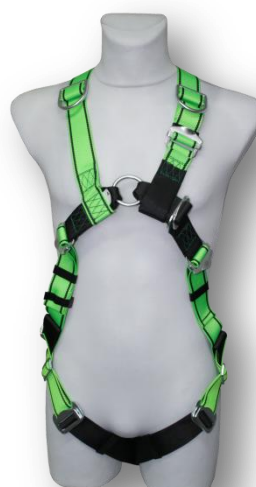
Abb. MB30-R Vorderseite